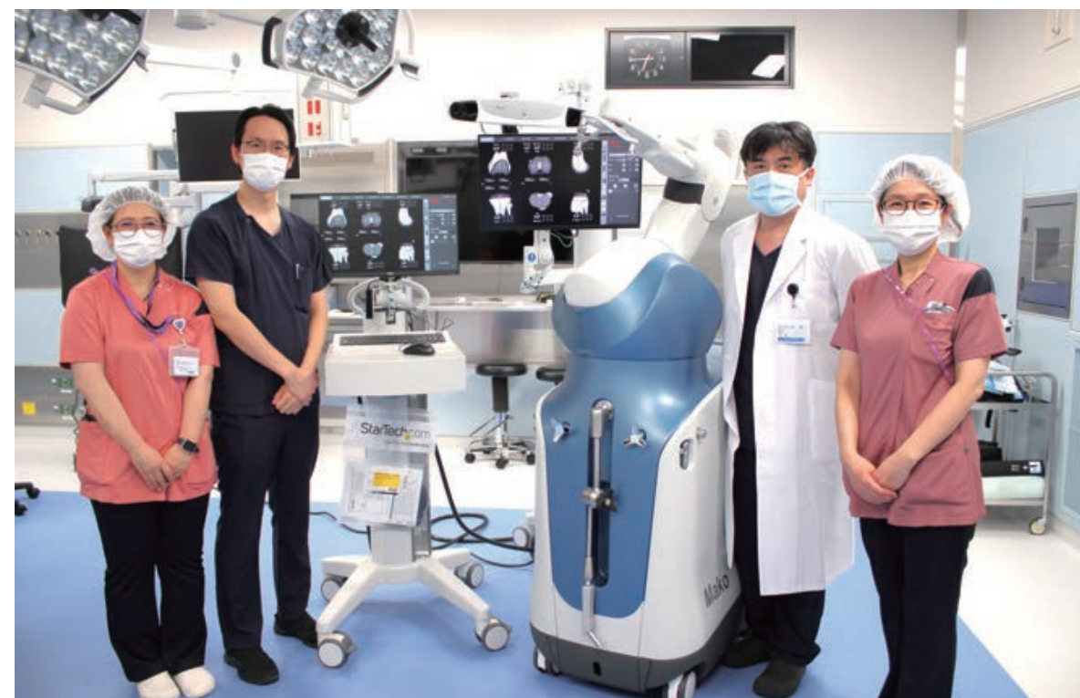
MakoSystemと人工関節手術チーム