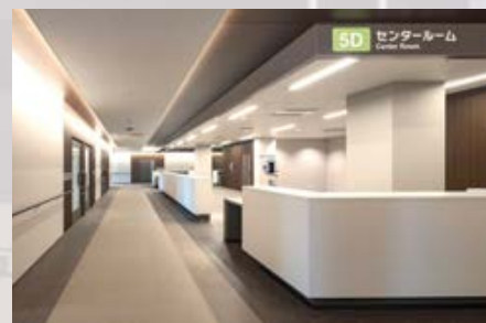
病棟センタールーム