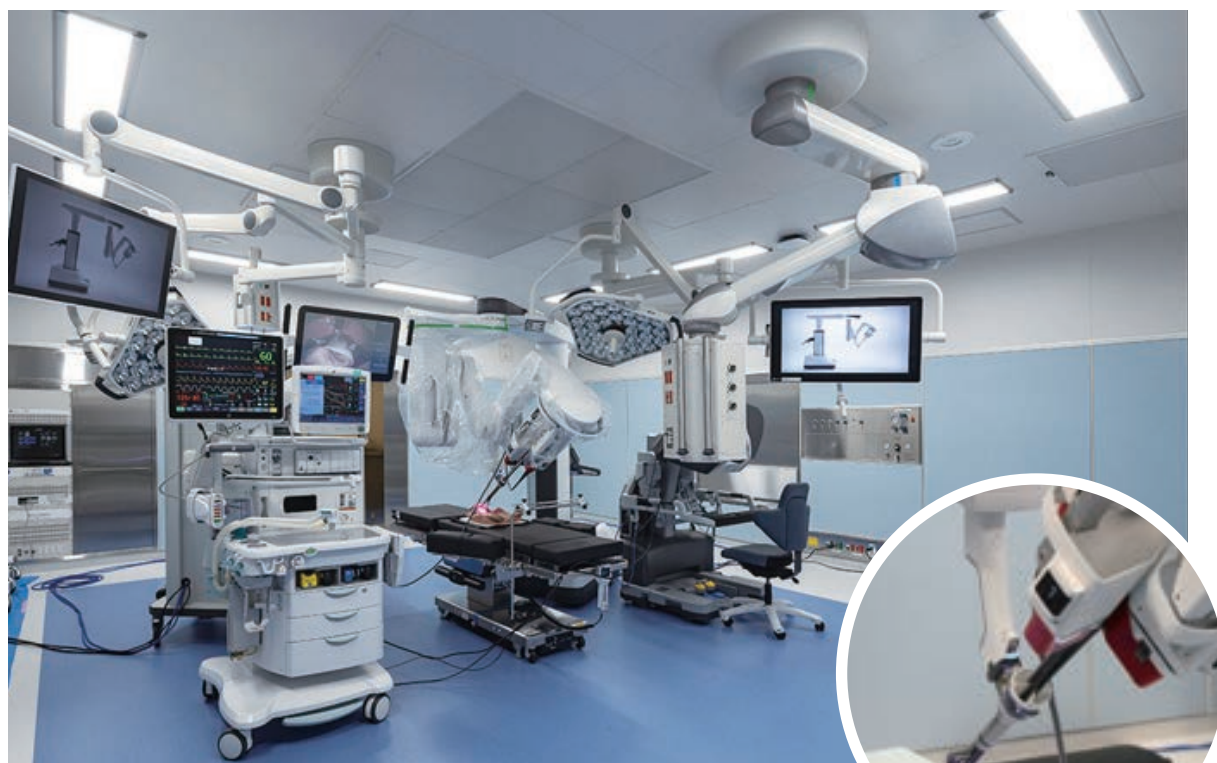
ダビンチSP導入手術室