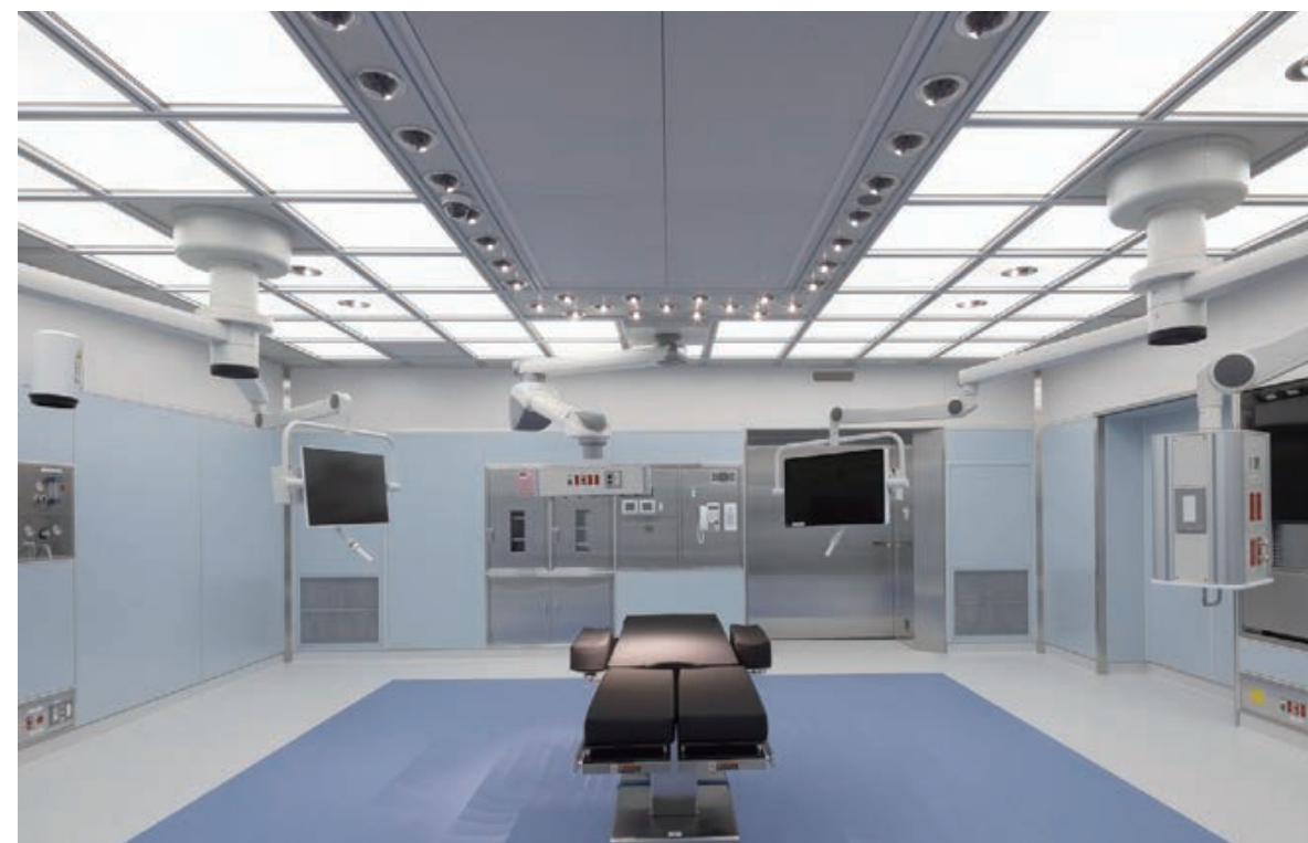
オペルミ®導入手術室

オペルミ®は、株式会社大林組が国立大学法人大阪大学大学院医学系研究科と共同で開発した、従来の手術室にある无影灯を必要としない、天井全面に无影灯と同等の照明機能を持たせた手術室です。術野を照らす可動式のライトと、手術室全体を均等に照らすフルカラー