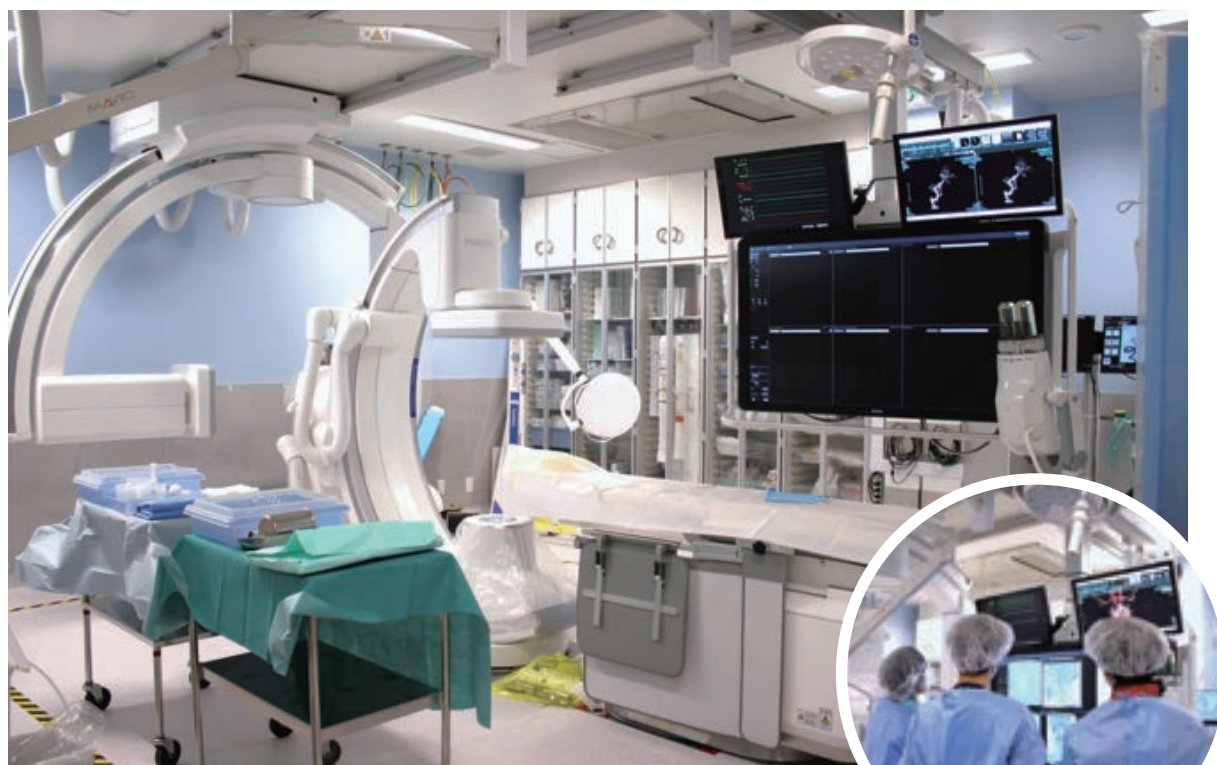
Azurion 7 B20/15 Rel.3.0を導入した血管造影室