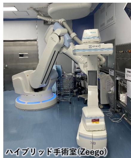
ハイブリッド手術室(Zeego)