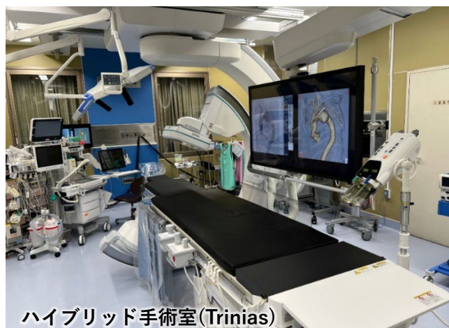
ハイブリッド手術室(Trinias)

1室はSIEMENS社製 Artis Zeego が導入され、脳神経外科や整形外科などの様々な手術に使用しています。