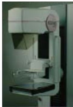
マンモグラフィ(乳房撮影装置)

当ドックでは、女性スタッフによるマンモグラフィ撮影、超音波検査、乳がん専門医(男性)