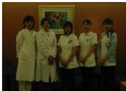
人間ドッククリニックの女性スタッフ